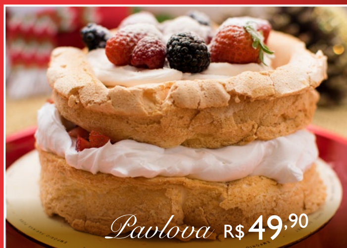
Pavlova R$ 49,90

*Fretes limitados com taxa de R$ 70. As encomendas de Ceias para o Natal serão aceitas até o dia 22/12, até às 18h, e para os itens de festa, até 23/12 até às 12h. As entregas e/ou retiradas na loja serão realizadas no dia 24/12. Para o Ano Novo, as encomendas de ceias e itens de festas serão aceitas até o dia 29/12, até às 18h. As entregas e/ou retiradas na loja serão realizadas no dia 31/12. Antecipe sua encomenda e ganhe descontos.