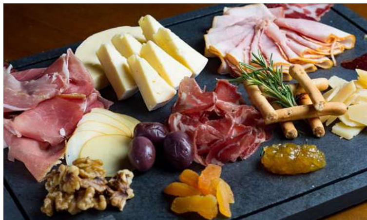
Serve 2 pessoas