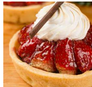
Tartelete de Morango