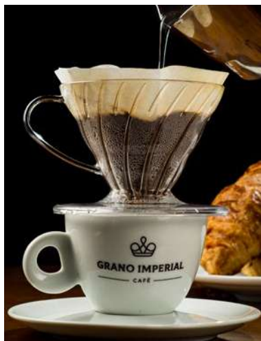
Café Coado na V60

Grano Imperial café é uma mistura de regiões e processos de secagens diferentes. Sul de Minas, Cerrado Mineiro e Alta Mogiana. E leva a assinatura do Farinha Pura.