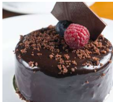
Entremet de Chocolate