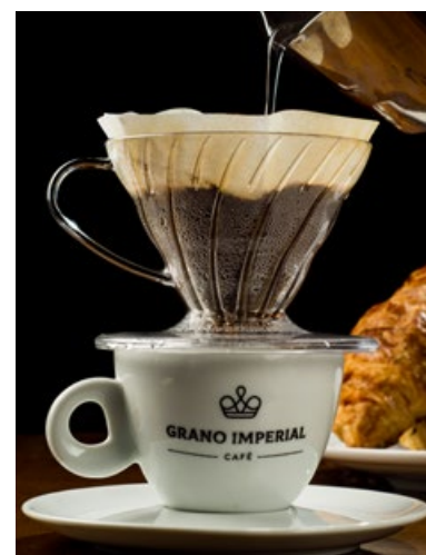
Café Coado na V60

Grano Imperial café é uma mistura de regiões e processos de secagens diferentes. Sul de Minas, Cerrado Mineiro e Alta Mogiana. E leva a assinatura do Farinha Pura.