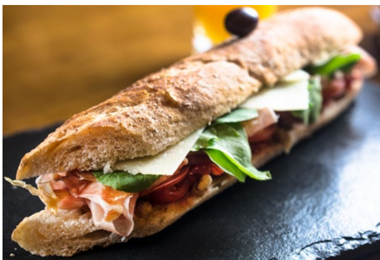
Sanduiche de Parma