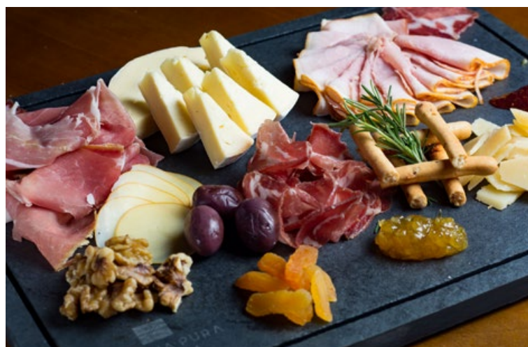
Serve 2 pessoas