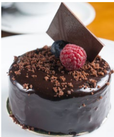
Entremet de Chocolate