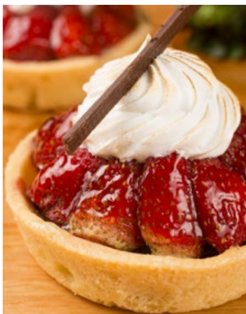
Tartelete de Morango