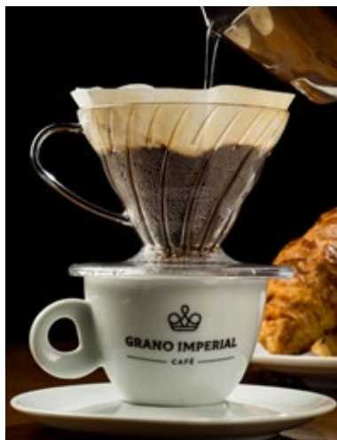
Café Coado na V60

Grano Imperial café é uma mistura de regiões e processos de secagens diferentes. Sul de Minas, Cerrado Mineiro e Alta Mogiana. E leva a assinatura do Farinha Pura.