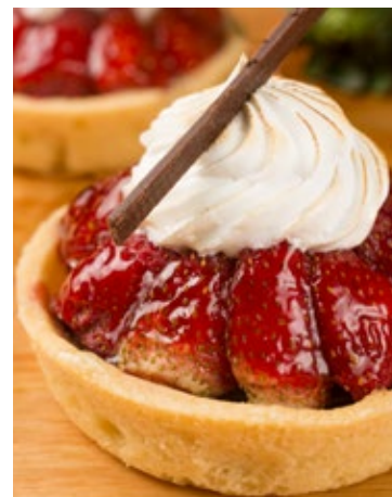
Tartelete de Morango