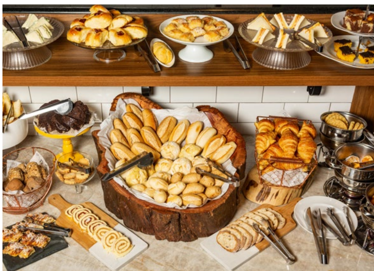
Buffet de Café da Manhã