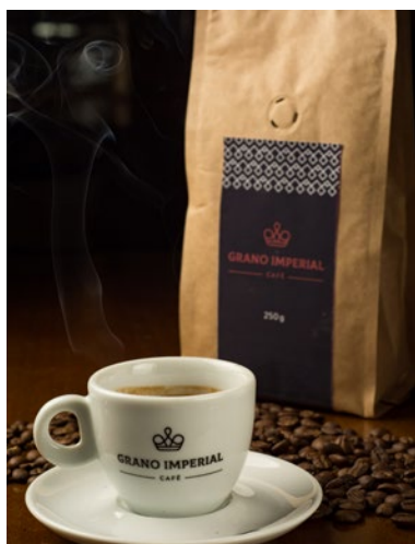
Café Grano Imperial

Grano Imperial café é uma mistura de regiões e processos de secagens diferentes. Sul de Minas, Cerrado Mineiro e Alta Mogiana. E leva a assinatura do Farinha Pura.